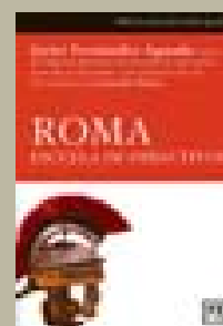
Roma, escuela de directivos Javier Fernández LID 19,90 euros

El empresario y autor de uno de los blogs más visitados de internet ( ga-pingvoid.com ), Hugh Macleod despierta a los lectores para que alcancen el éxito y propone una estrategia para lograr las metas profesionales deseadas. Una obra necesaria para todo aquel que quiera cambiar de rumbo.