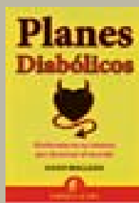
Planes diabólicos Hugh Macleod Empresa Activa 192 páginas

Google es una de las empresas más poderosas de la actualidad. En lo que no se ha profundizado es en la historia oculta de la multinacional: problemas de privacidad, acusaciones de monopolio, frentes abiertos con operadoras, etc. Alejandro Suárez destripa en este libro cada una de los secretos de la compañía, desde sus problemas con China hasta sus relaciones con empresas como Apple. Una obra documentada con documentos y entrevistas con gente del sector y exempleados de la multinacional.