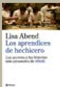
Los aprendices de hechicero Lisa Abend Planeta 20 euros