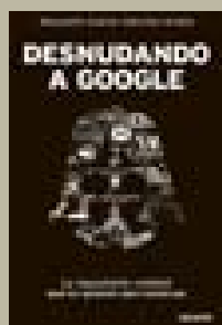
Desnudando a Google Alejandro Suárez Deusto 17,95 euros

aprender del que ha sido considerado el mejor chef del mundo. En esta obra se relatan algunas de las historias que han tenido lugar entre las paredes y fogones del famoso local catalán; un libro homenaje a esos jóvenes que han trabajado gratuitamente para convertirse en los auténticos cocineros de élite del futuro.