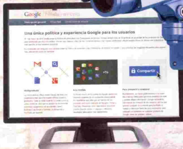
Google avisó convenientemente a todos los usuarios de este cambio. Sin embargo, no es posible no aceptar estas nuevas normas.

páginas más visitadas en EE.UU., según reciente estudio, 92 recogían información para Google. Y el usuario de a pie desconoce esto. Para dejar de alimentar con nuestros datos personales a Google, literalmente, habría que darse de baja del mundo". De hecho, las nuevas políticas de privacidad también señalan que Google se reserva el derecho de compartir los datos personales de sus usuarios con compañías, organizaciones o personas externas al buscador, en el caso de que la empresa tenga "una buena razón debido a temas legales, regulaciones, procesos legales o requerimientos gubernamentales que justifiquen el acceso, uso, preservación